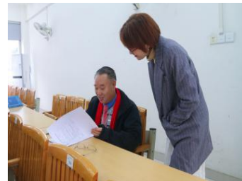
教学督导听课与交流