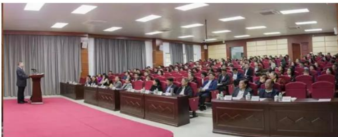
中山大学新华学院2019年春季工作会议现场

报告最后，周书记强调，学校党委将高举中国特色社会主义伟大旗帜，以习近平新时代中国特色社会主义思想为指导，深入学习领会党的十九大和十九届二中、三中全会精神，深入学习贯彻全国教育大会精神，增强“四个意识”，坚定“四个自信”，坚决做到“两个维护”，全面贯彻党的教育方针，落实立德树人的根本任务，按照新时代党的建设总要求，以“组织力提升”为主题，构建党组织对各类基层组织的全面领导工作机制，切实提升基层党组织建设质量，为学校的健康发展提供坚强的政治保证和组织保证。