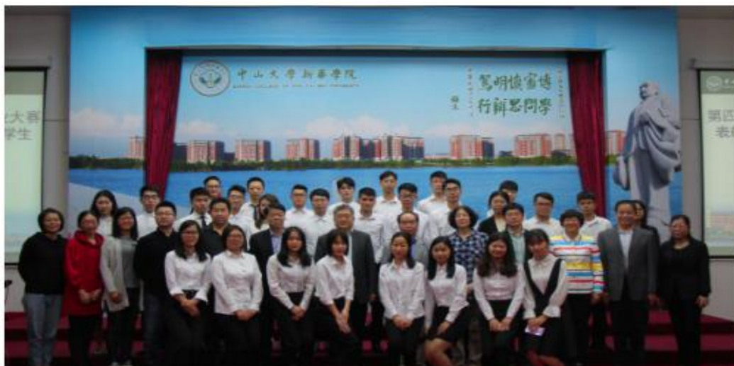
获奖同学与校领导合照