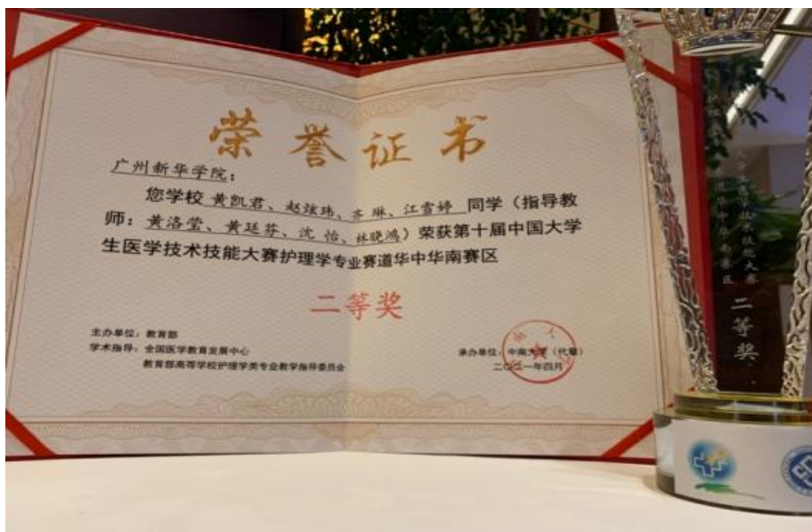
图为团体奖状及奖杯