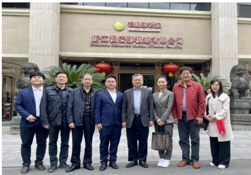
浙江横店影视城有限公司大楼

4月9日上午，广州新华学院和浙江横店影视城有限公司签约揭牌仪式在浙江横店影视产业实验区本部大楼举行。双方签署了“广州新华学院校外实践教学基地协议书”，并现场揭牌。此举标志着校企合作、产学研结合的人才培养新模式正式启动，一种优势互补、合作共赢，努力打造高素质复合型传媒影视人才的前景值得期待。