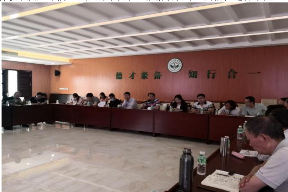
（新设专业招生评估汇报会现场）

最后，由校领导、教务处、学科与科技管理处、人事处、设备与实验室管理处、教育教学质量评估处组成的评议小组根据新设专业的情况进行了招生评议。