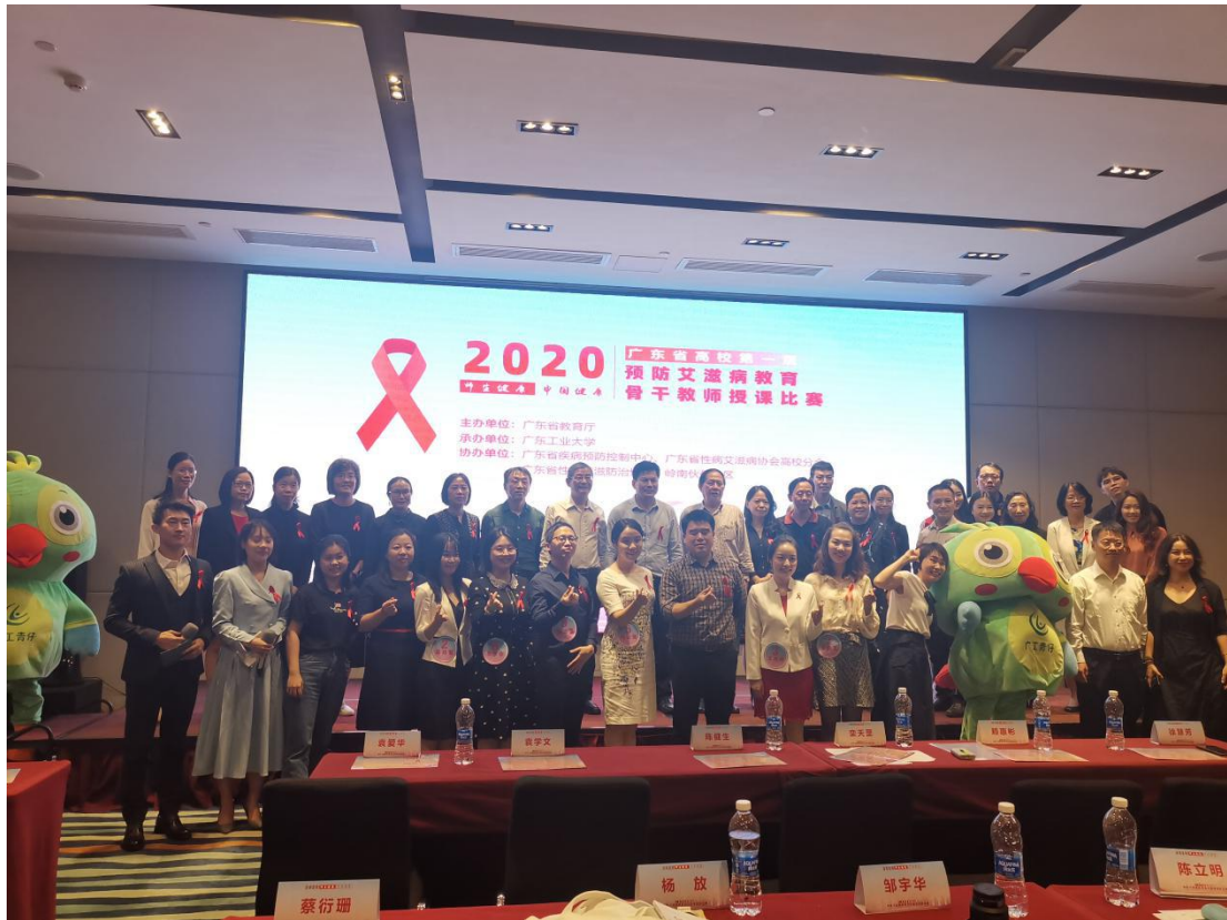
现场选手与评委嘉宾合影留念