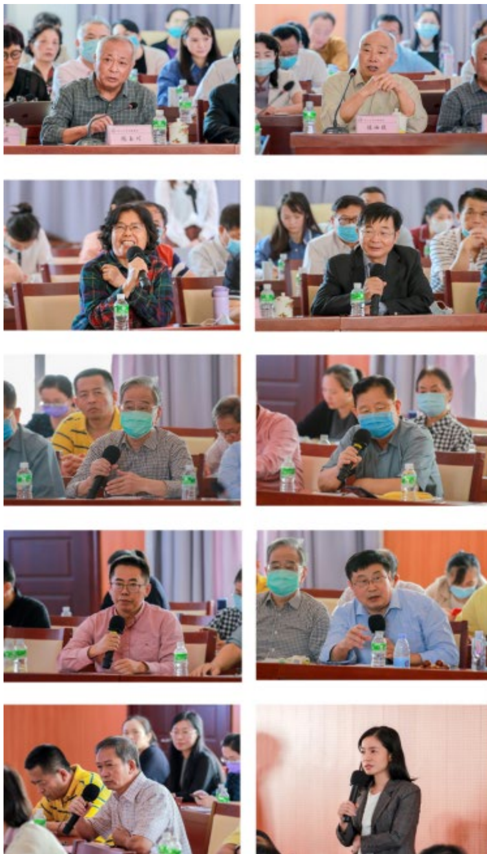
教学单位负责人、首席教授、学科带头人等学者专家建言献策