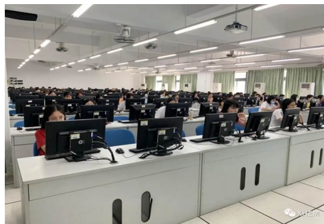
图：东莞校区比赛现场 3

本次比赛受到学校以及外国语学院领导的高度重视，外国语学院教职工积极筹备赛前相关工作，在学校设备与实验室管理处、信息与网络管理处有力的技术支持下，本次线上初赛顺利有序地展开。阅读线上初赛时长 110 分钟，均为客观题，包含三大板块：Read and Know（读以明己）、Read and Reason（读以察世）和 Read and Question（读以启思）。三大板块依次考查参赛学生的阅读广度、对各类短小文本的理解能力，对多题材、多体裁短篇文本的信息获取、判断、逻辑推理能力，以及对多篇同主题较长文本的信息获取、对比、分析及整合能力。