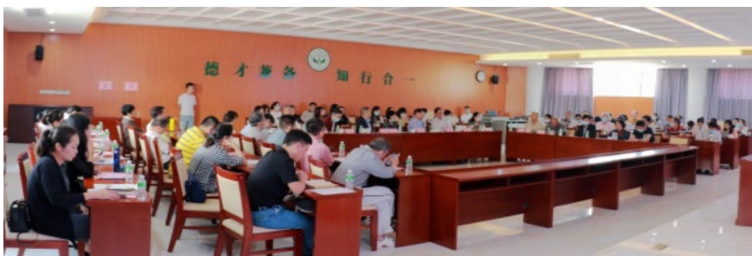
中山大学新华学院召开 2020 年人才工作座谈会