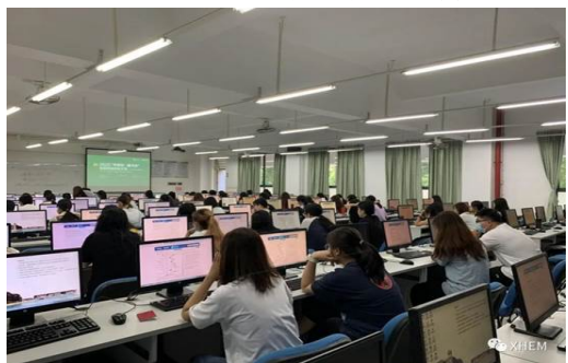
图：东莞校区比赛现场 2