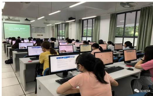
图：东莞校区比赛现场 1