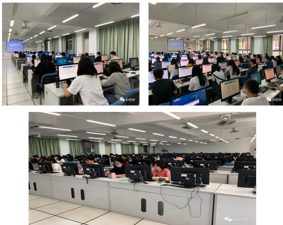
图：写作大赛初赛现场

写作大赛初赛时长 120 分钟，赛题包括一篇议论文，一篇说明文或应用文。本次比赛考查了议论文和说明文两种文体，议论文针对今年尤其火热的直播带货现象，说明文邀请学生分享对网络课堂的感受与反思。由此可见，近年来外研社写作比赛的话题非常贴近当下的时事热点。