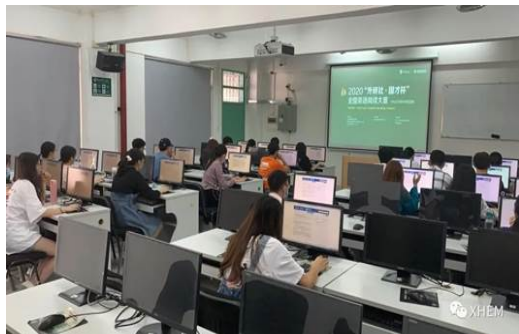
图：广州校区比赛现场 1

公司联合教育部高等学校大学外语教学指导委员会、教育部高等学校英语专业教学指导分委员会以及中国外语教育研究中心共同举办。